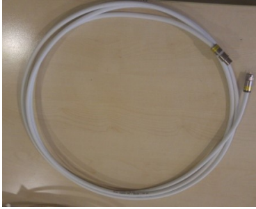
ören Jumper UE-HD103 - IECM -3 m