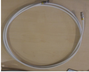
ören Jumper CX3-HD103 - IECM -3 m