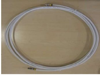
ören Jumper UE-HQ103 - IECM -5 m