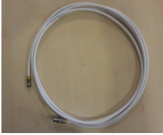
ören Jumper CX3-HQ103 - IECM -5 m