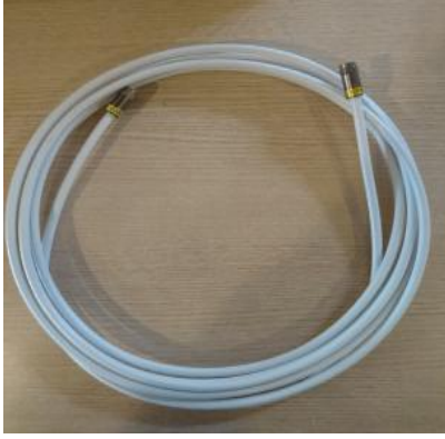
ören Jumper FM - HD103 - FM (CX3) 3 m