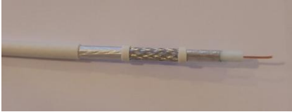
HQ 103 PVC

Kablo Tipi: HQ103 Trishield, 63% Kapama, Tavlı Bakır, PVC Kılıf Boyları: 0.25,1, 3,5,10 m Konnektör : Cabelcon markasının F56-CX3 4.9 modeli