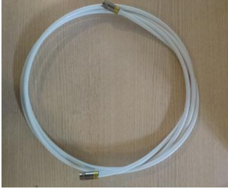
ören Jumper FM - HQ103 - FM (CX3) 3 m